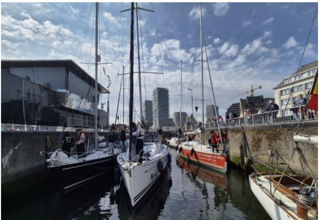
Passage de l'écluse à Ostende